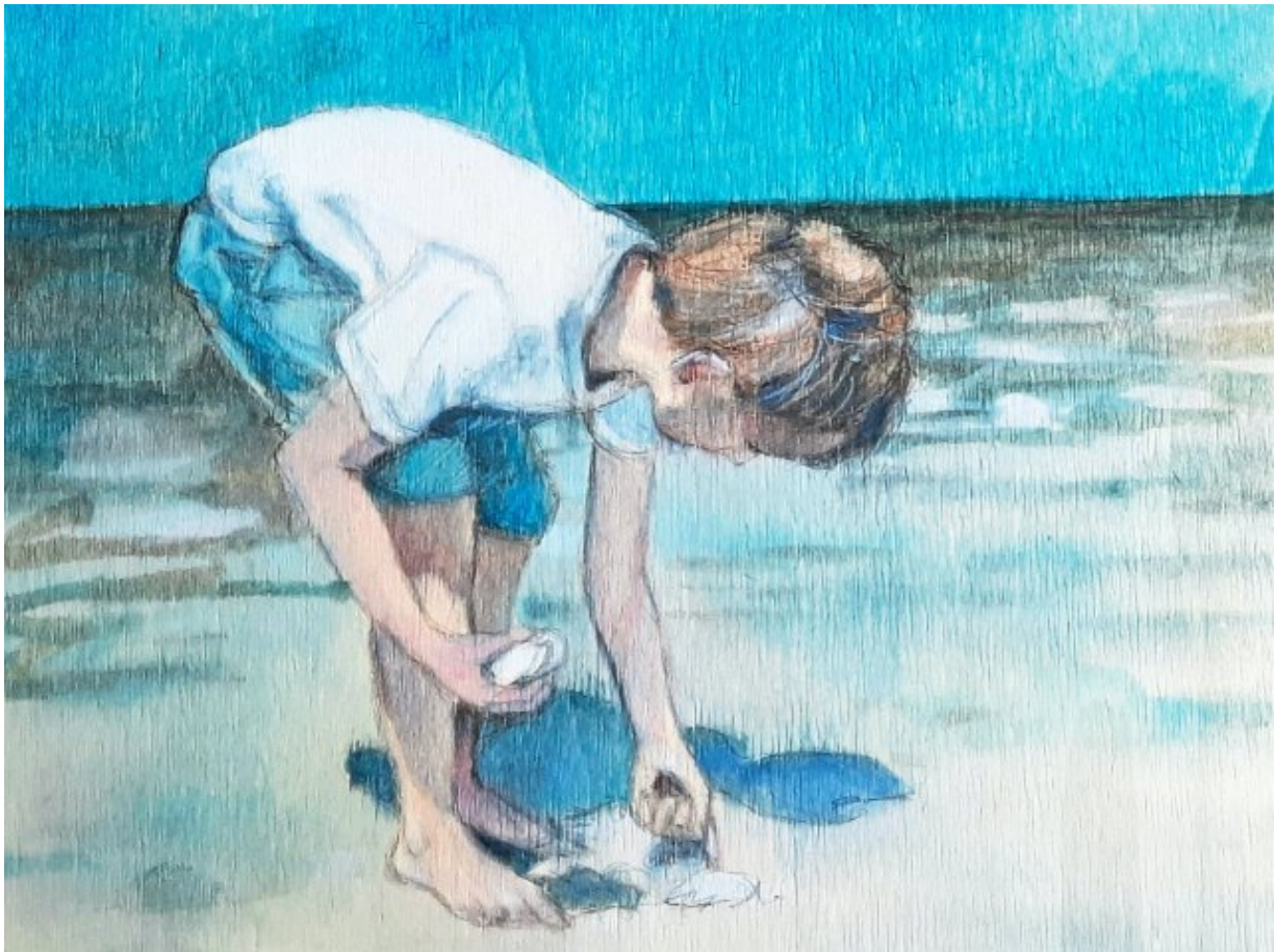
Ein Gemälde der Künstlerin Susanne Klena. Ein Junge sammelt Muscheln am Strand. Foto: Susanne Klena