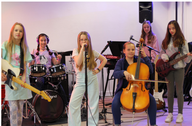
Die Frechen Fritten

Bands der Musikschule Wedel - Live: Mystery Girls, The Green Lemons, Not My Fave, Blue Fire, Midnight, Pandacover, Rister Twister, Die Elbmarshmallows, The Schlingels, Die Frechen Fritten, Abgedreht, Unmuted, Eltern-A-Band, Flacker