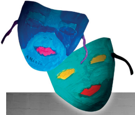
Tanz- und Gymnastikstudio am Roland

übernimmt die Lehrerband der Musikschule Wedel das Zepter auf der Bühne bei der „Kulturnacht-Abschlussparty“